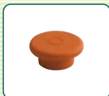
本体ホルダー 挿入部用キャップ