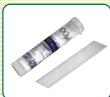
キャピラリー 100本入